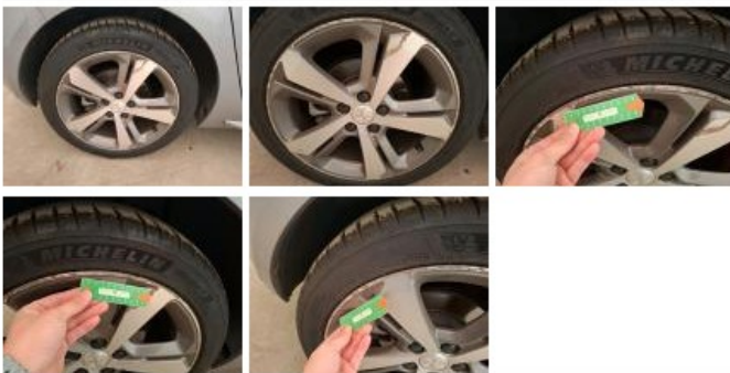
Jante alum. AVD bi-ton/polychrome, Griffe(s), Réparer/rempl. (montant forfaitaire)