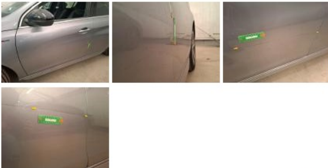
Porte ARG, Griffe(s), 67 - Lustrage