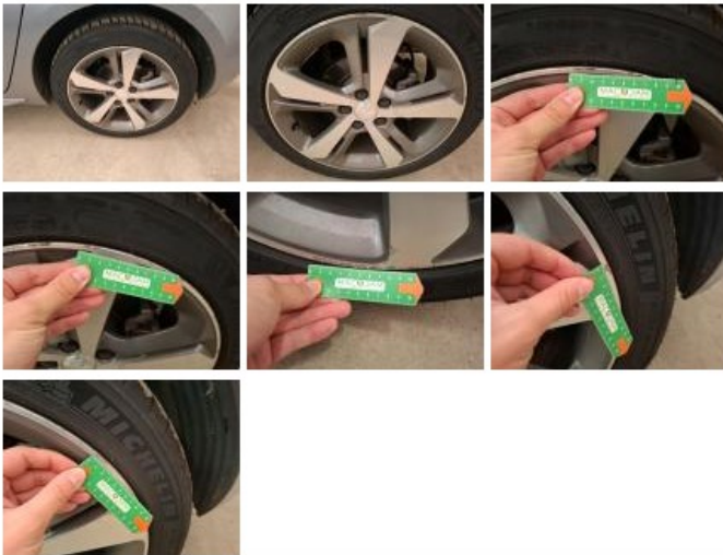
Jante alum. ARD bi-ton/polychrome, Griffe(s), Réparer/rempl. (montant forfaitaire)