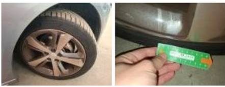
Aile AVG, Griffe(s), Peindre