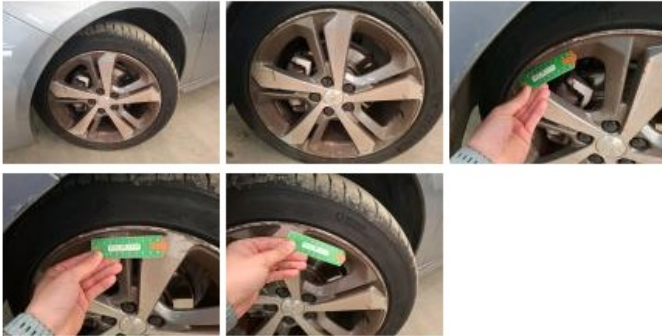
Jante alum. ARG bi-ton/polychrome, Griffe(s), Acceptable