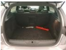
Joint de coffre, Déchirure, E - Remplacer