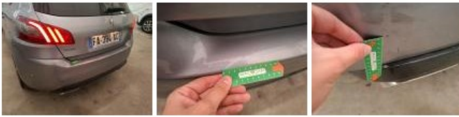
Jupe AR, Griffe(s), Peindre