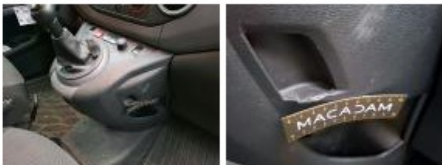
Soufflet levier de vitesse, Déchirure, E - Remplacer