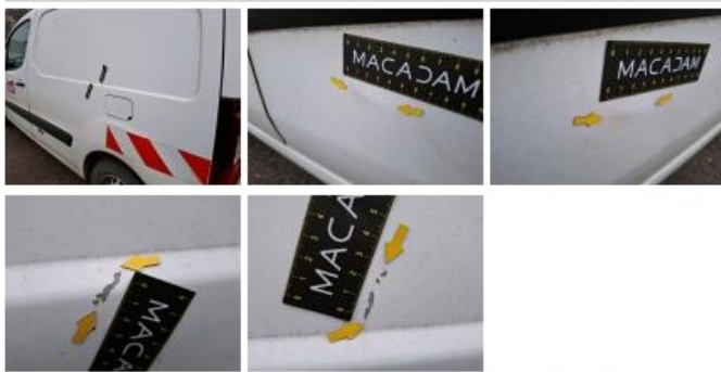
Porte AVG, Griffe(s), Acceptable