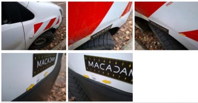
Joint de porte AR, Déchirure, E - Remplacer