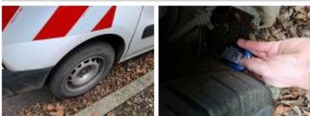
Enjoliveur de roue ARD, Manque, E - Remplacer