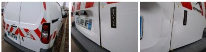
Porte de malle AR G, Bosse(s) et griffe(s), LI - Réparer et peindre (complet)