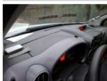
Tableau de bord, Résidu de colle, Acceptable