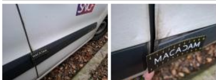
Aile AVD, Bosse(s) et griffe(s), LI - Réparer et peindre (complet)