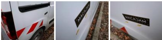
Porte AVD, Griffe(s), Peindre