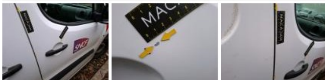
Moulure porte AVD, Dégrafé, Dépose/Répose