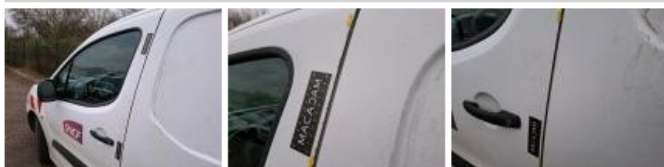
Moulure porte AVG, Griffe(s), Réparer/rempl. (montant forfaitaire)