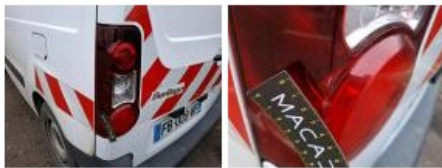
Pare-chocs AR, Déformé / Forcé, LI - Réparer et peindre (complet)