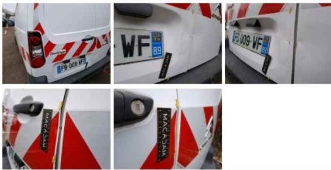
Carrosserie, Pas d'origine, Acceptable