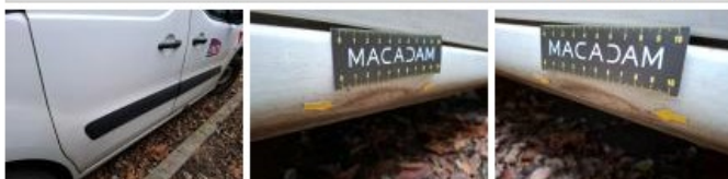
Panneau ARD, Bosse(s), LI - Réparer et peindre (complet)