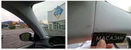
Garnit. montant AVD, Déchirure, Réparer/rempl. (montant forfaitaire)