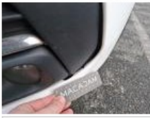
Aile AVD, Bosse(s), LI - Réparer et peindre (complet)