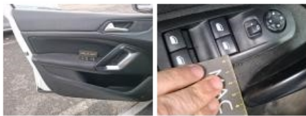
Garniture porte AVG, Brûlé, E - Remplacer