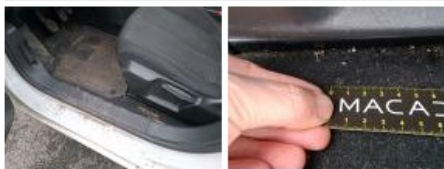
Intérieur, Tache, Nettoyer