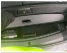
Coffre / hayon, Bosse(s) et griffe(s), LI - Réparer et peindre (complet)