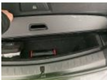
Kit réparation pneu, Manque, Réparer/remplacer (montant forfaitaire)