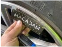
Jante alum. AVG, Griffe(s), Réparer/remplacer (montant forfaitaire)