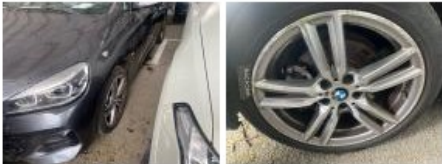
Pare-chocs AV, Griffe(s), Acceptable