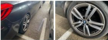
Jante alum. ARG, Griffe(s), Réparer/remplacer (montant forfaitaire)