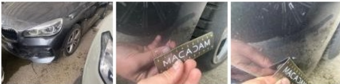
Porte AVD, Bosse(s), LI - Réparer et peindre (complet)