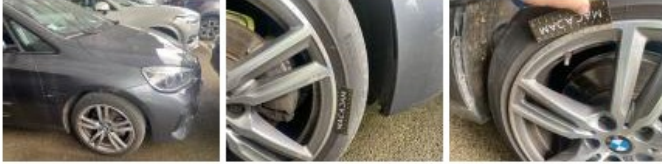
Jante alum. ARD, Griffe(s), Réparer/remplacer (montant forfaitaire)