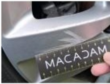
Jante alum. AVD, Griffe(s), Réparer/rempl. (montant forfaitaire)