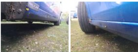
Porte AVG, Griffe(s), Acceptable