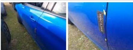
Porte ARG, Griffe(s), Lustrage