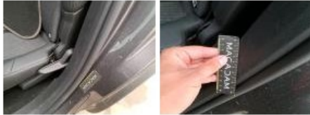
Bas de caisse int ARD, Bosse(s) et griffe(s), LI - Réparer et peindre (complet)