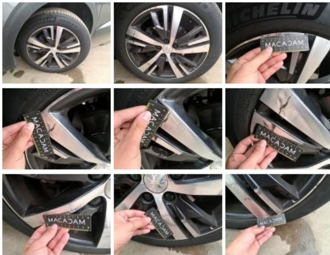
Jante alu ARG bi-ton/polychrome, Griffe(s), Réparer/remplacer (montant forfaitaire)