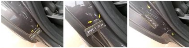
Garniture montant Mil D, Griffe(s), Réparer/remplacer (montant forfaitaire)