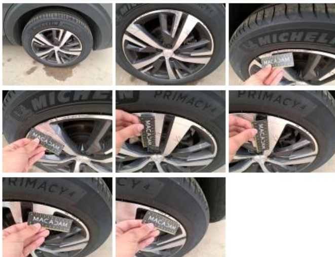
Jante alu ARD bi-ton/polychrome, Griffe(s), Réparer/remplacer (montant forfaitaire)