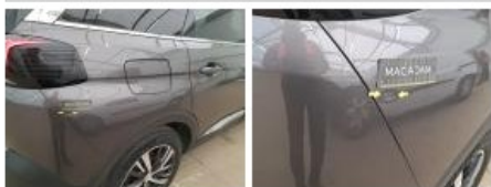
Porte ARD, Griffe(s), 67 - Lustrage