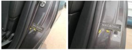
Garniture montant Mil G, Griffe(s), Réparer/remplacer (montant forfaitaire)