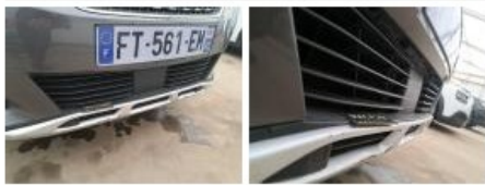
Moulure de pare-chocs AV, Griffe(s), Peindre