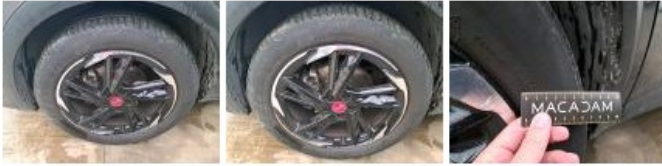
Jante alum. AVD bi-ton/polychrome, Griffe(s), Réparer/remplacer (montant forfaitaire)