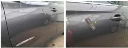
Porte ARG, Griffe(s), Peindre