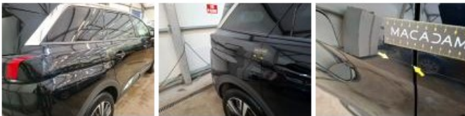
Répétiteur D, Griffe(s), Acceptable