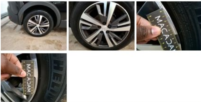
Jante alum. ARG bi-ton/polychrome, Griffe(s), Réparer/rempl. (montant forfaitaire)