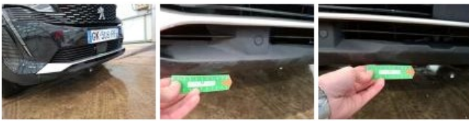
Moulure de pare-chocs AV, Dégrafé, Acceptable