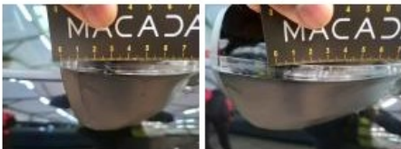
Cache bagages, Déformé / Forcé, Réparer/rempl. (montant forfaitaire)