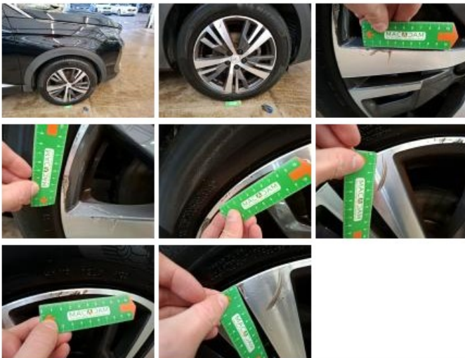
Jante alum. ARD bi-ton/polychrome, Griffe(s), Réparer/rempl. (montant forfaitaire)