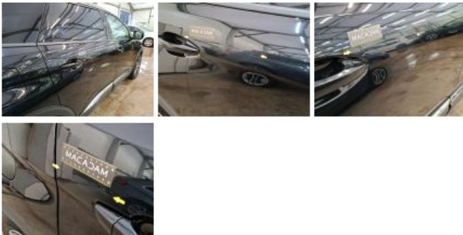
Aile ARD, Griffe(s), Acceptable